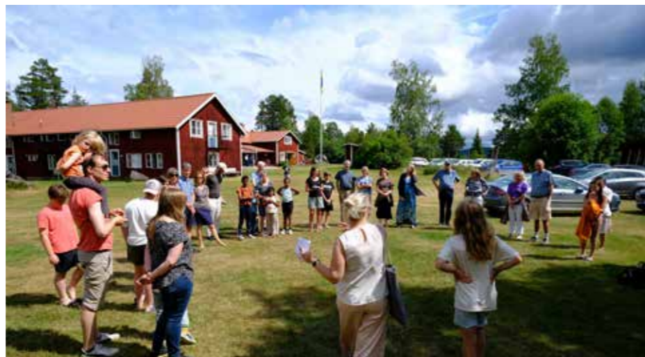
Femkamp för alla åldrar på sommarkonferensen

Styrdokumentet för EFS Mittsveriges fonder har reviderats så att det framgår att fondansökningar även bedöms utifrån integrationsaspekter. Under året har fondmedel t.ex. bidragit till en kulturfest som samarrangerades av missionsföreningen i Bäckbykyrkan och den farsitalande föreningen i Västerås.