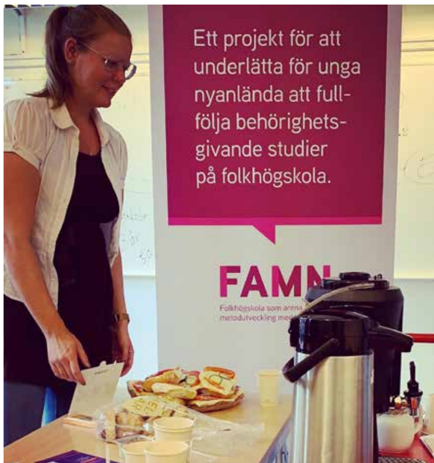
Verksamhet på Hagaberg

Skolrådet har mötts på distans kontinuerligt under hösten, och beslutade om insamlingsändamål för årets annorlunda basar-insamling. Under ett antal veckor fanns försäljning av kransar, gåvokort, loppisfynd med mera. Insamlingen gick till EFS aktion SeBeGe, för att möta följdverkningarna av coronapandemin och gräshoppsinvasionen i östra Afrika med flera mission-