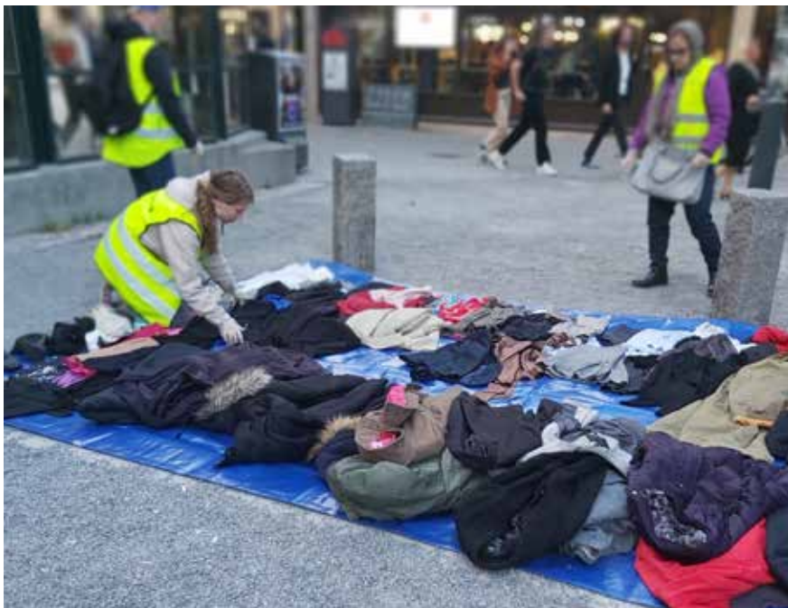
Klädutdelning på Medborgarplatsen i Stockholm.

det tryggt att vi under året har tecknat nya hyresavtal som sträcker sig minst fyra till fem år framåt i tiden.